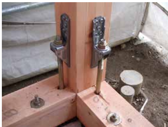
基礎 ホールダウン金物

木造の戸建て住宅では耐震性や建物の強度という点において、木材の部材同士の接合部は弱点となりがちです。耐震金物を用いて接合部を強固にすることで柱や梁の強度が向上、地震発生時の建物の揺れを抑制し、建物全体の耐震性を高めます。