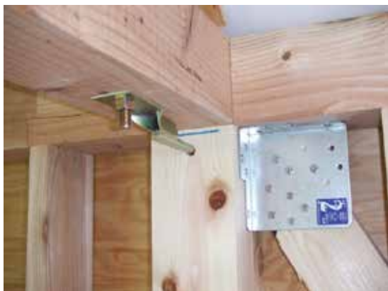
壁 筋交いプレート